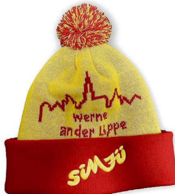
So sieht der neue Sim-Jü-Werbeartikel aus. Das Werne Marketing wartet sehnsüchtig auf die Lieferung der Mützen.

Bei dem neuen Werbeprodukt handelt es sich um die Sim-Jü-Mütze . Sie ist in den Werne Stadtfarben Gelb und